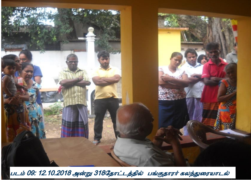
படம் 09: 12.10.2018 அன்று 318தோட்டத்தில் பங்குதாரர் கலந்துரையாடல்