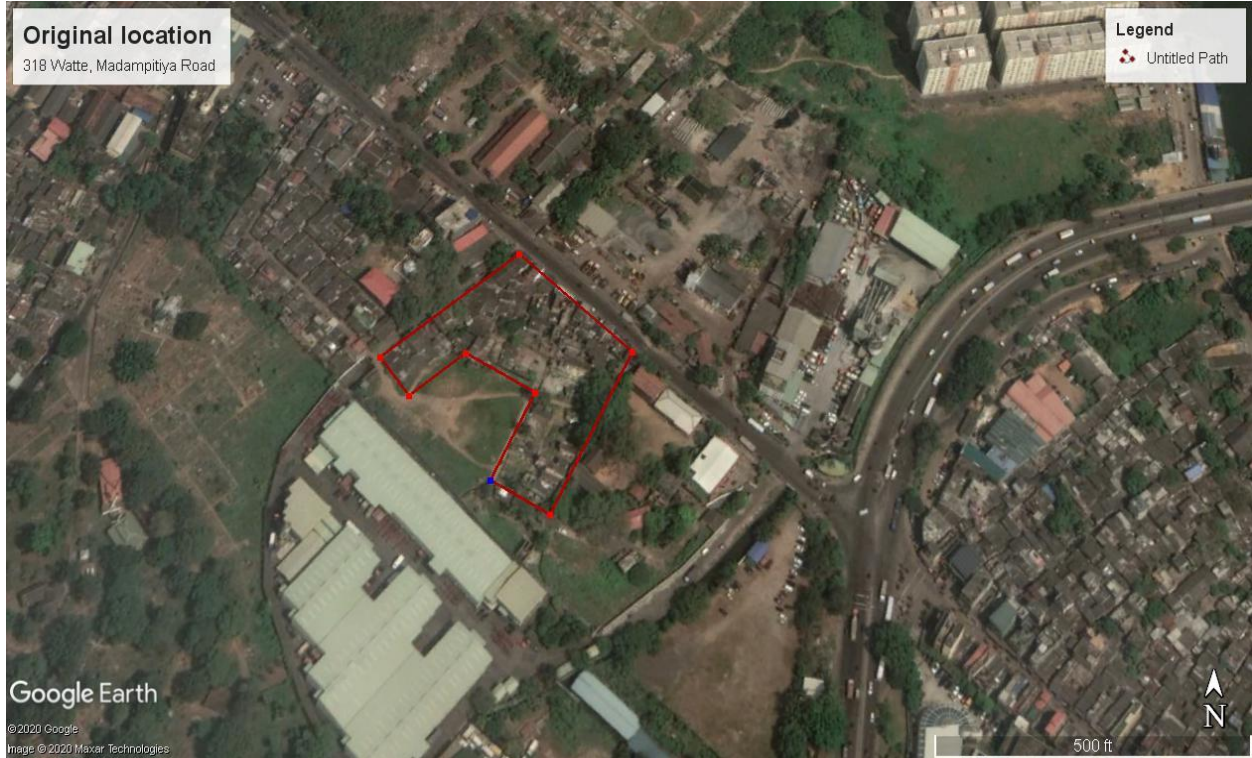
படம் 2 - மாதம்பிட்டிய வீதியில் அமைந்துள்ள 318 ஆம் இலக்க தோட்டத்தின் உண்மையான அமைவிடம்