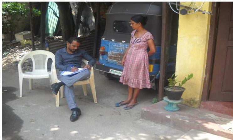
படம் 6 – 318 ஆம்தோட்டத்தில் ஒக்டோபர் 16 அன்று நடாத்தப்பட்ட திட்டத்தினால் பாதிக்கப்பட்ட மக்கள் தொடர்பிலான ஆய்வு

கணக்கெடுப்பு ஆய்வு தொடர்பான, தயார் செய்தலில், வினாக்கொத்து வகைகள், நேர்காணல் நுட்பங்கள், பங்குதாரர்கள் சந்திப்பு மற்றும் தகவல் வெளிப்படுத்தல் ஆகியவற்றை உள்ளடக்கி பிரத்தியேக பயிற்சி ஒன்று திட்டக் குழுவிற்கு நடாத்தப்பட்டது. கணக்கெடுப்பை திட்டத்தினால் பாதிக்கப்பட்ட குடும்பங்களுக்கு சூழ்நிலைப்படுத்தவும், அவர்களின் முனைப்பான பங்குபற்றலை உறுதி செய்யவும் கணக்கிடும் குழுவுக்கு அறிவுறுத்தப்பட்டது. பாதிக்கப்பட்ட கட்டமைப்புக்கள், நில உடமை, அசையும் மற்றும் அசையாச் சொத்துக்கள், வணிகங்கள், திட்டத்தினால் பாதிக்கப்பட்ட குடும்பங்களின் வருமானங்கள் மற்றும் செலவினங்கள், மக்கள் தொகை, கல்வித்தகைமை, பாதிக்கப்படக்கூடிய தன்மைகள், சமூக தொடர்புகள், சுகாதார வசதிகளுக்கான அணுகல், சமூக நடவடிக்கைகளில் பெண்களின் பங்கேற்பு, மற்றும் பாதிக்கப்படக்கூடிய மக்களுக்கு கிடைக்கக்கூடிய அரசின் உதவி பற்றிய தரவுகளை கணக்கெடுப்பானது சேகரிக்கின்றது. இந்த குடியமர்த்தல் திட்டத்தினை தயார் செய்வதற்கு இந்த தரவுகள் பின்னர் பயன்படுத்தப்பட்டுள்ளன.