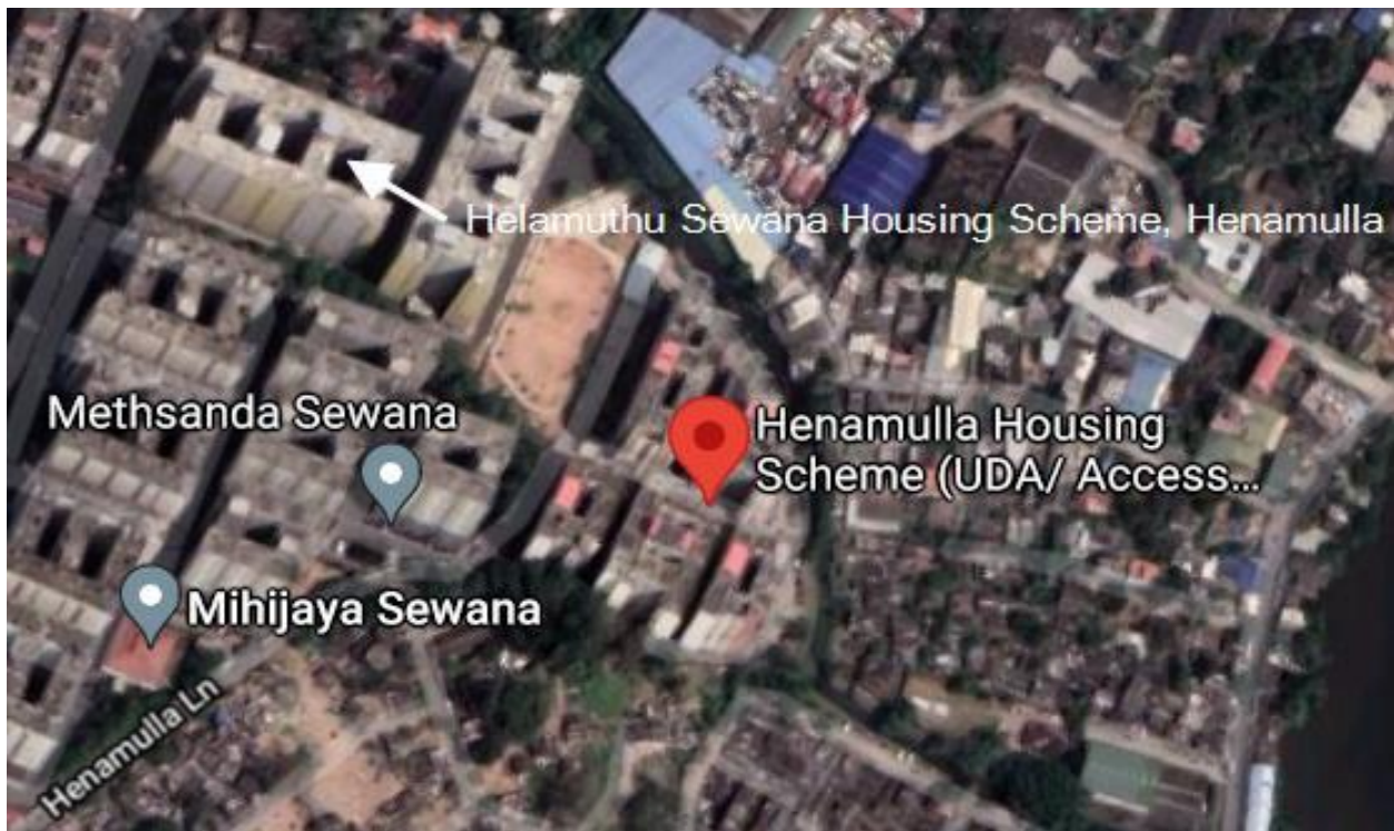
படம் 3 -கொழும்பு 15 இல் அமைபப் பெறவுள்ள ஹெலமுது செவண மற்றும் ஹேனமுல்லை மீள் குடியமர்த்தல் பகுதிகள்