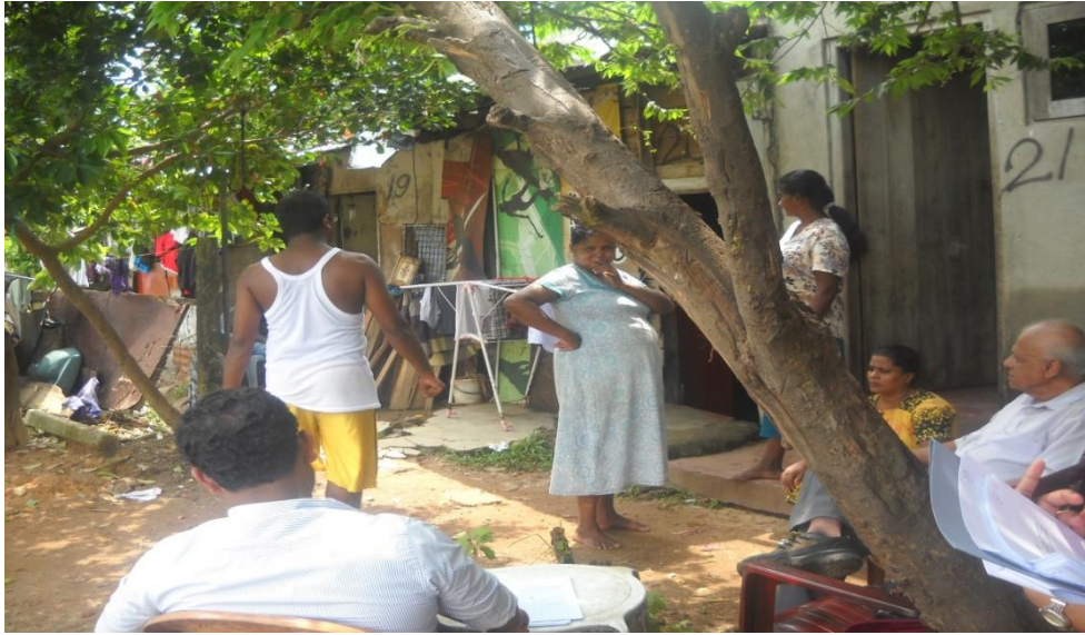
රූප සටහන 3: 2018 10.11 දින ඔබේසේකරපුර පැවැත්වූ පාර්ශ්වකරුවන්ගේ රැස්වීම